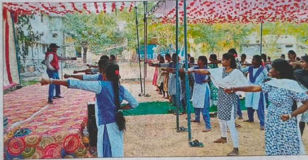
ఆత్మ రక్షణ కళలో శిక్షణ పొందుతున్న విద్యార్థినులు