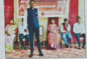
అవగాహన కల్పిస్తున్న ఉపాధ్యాయులు